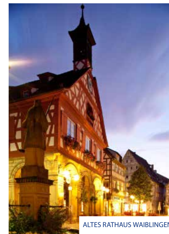
ALTES RATHAUS WAIBLINGEN

Auch in Winnenden kann die Stadt im Rahmen einer Kinderführung erkundet werden. Mit fantasievoll entwickelten und unterhaltsamen Interaktionen werden die Unterschiede der Lebensumstände von damals und heute erfahrbar und lassen in alten Gassen die früheren Zeiten lebendig werden. Infos und Buchung unter: www.winnenden.de/kultur-sport-tourismus .