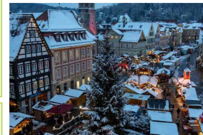
Diese und weitere Broschüren sind bei der Tourist-Information in Schwäbisch Gmünd erhältlich!

Stimmungsvolle Atmosphäre und ein tolles Rahmenprogramm erwartet die Besucher des diesjährigen Gmünder Weihnachtsmarktes vom 23. November bis 21. Dezember. Rund 75 geschmückte Stände verwandeln den Marktplatz und den Johannisplatz wieder in ein weihnachtliches Dorf und werden auch in diesem Jahr mit einem bunten Angebot an Weihnachtswaren und Leckereien die Menschen in die Gmünder Innenstadt locken.