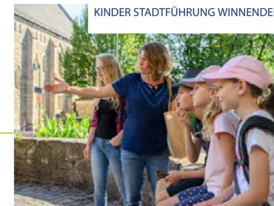
KINDER STADTFÜHRUNG WINNENDEN